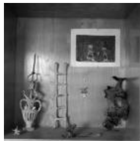
Joaquim Gomis. Col·lecció d'objectes de l'artista , 1944 Fons Joaquim Gomis, dipositat a l'Arxiu Nacional de Catalunya © Hereus de Joaquim Gomis. Fundació Joan Miró, Barcelona, 2023