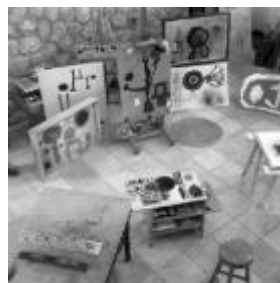
El taller de Joan Miró a Palma de Mallorca, 1956