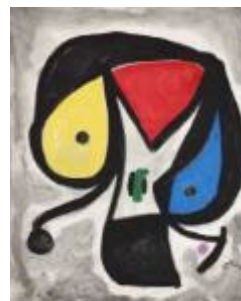
Joan Miró. Dona, 1978 Acrílic i oli sobre tela Fundació Joan Miró, Barcelona

Imatges d'obra i de la sala disponibles a http://bit.ly/UniversMiró