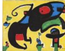
Joan Miró. Personatges i ocells en un paisatge nocturn, 1978 Oli sobre tela Fundació Joan Miró, Barcelona