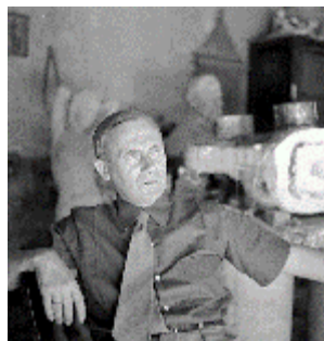
Joaquim Gomis. Retrat de Joan Miró, 1944