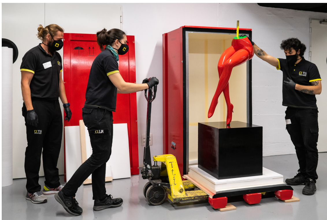
Preparació de les obres pel trasllat a Shanghai.

Imatges disponibles a: JM Women birds stars 2021