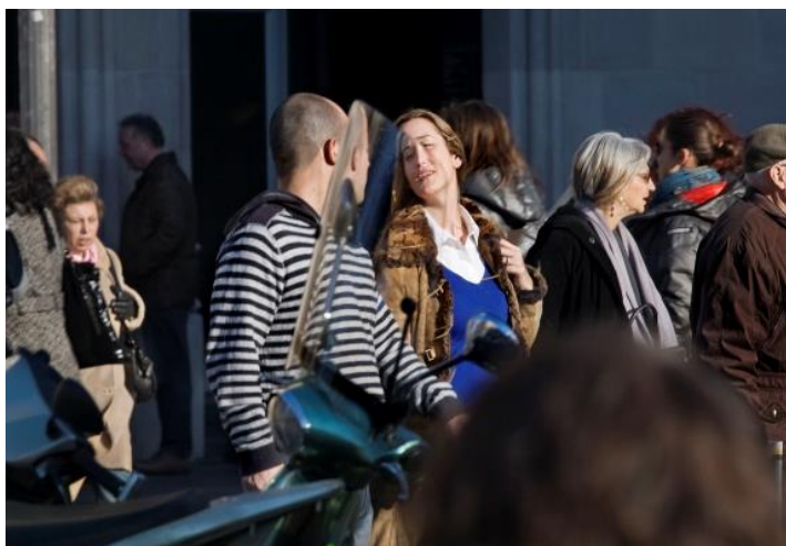
Vistes. Juande Jarillo.

Imatges disponibles a: https://bit.ly/Vistes_JuandeJarillo