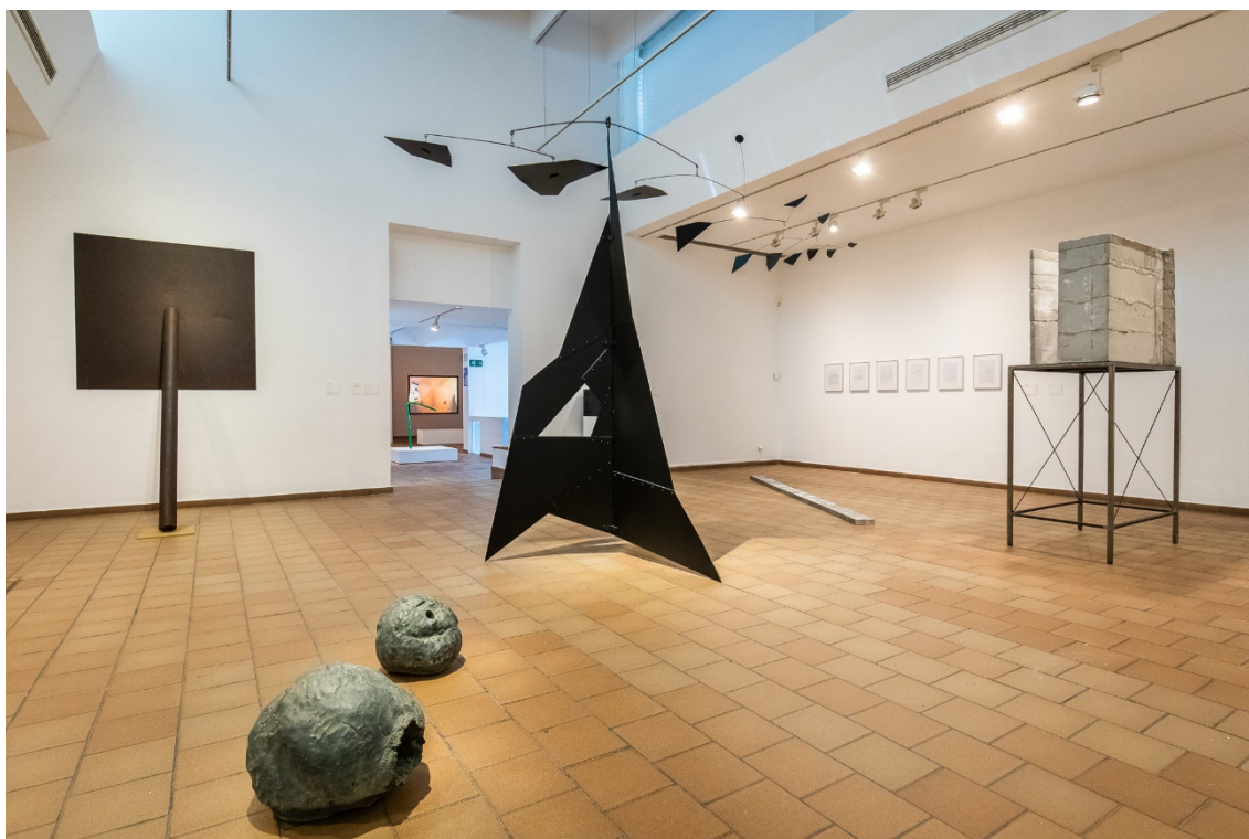
Imatge de les sales de l'exposició El sentit de l'escultura .

Imatges disponibles a El sentido de la escultura