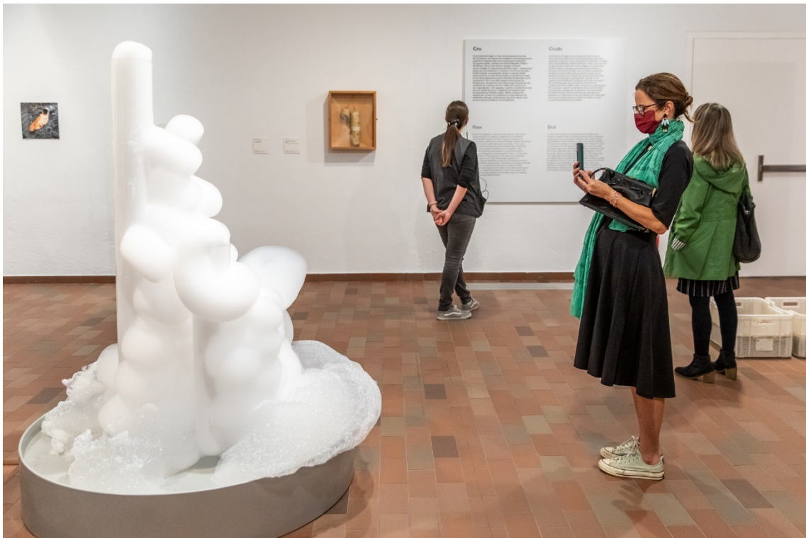
Vista de les sales de l'exposició El sentit de l'escultura .

El títol de l'exposició neix dels escrits del poeta i lingüista peruà Mario Montalbetti en què defensa el «sentit» de manera literal, com un concepte més proper a la manifestació d'una direcció que no pas a la fixació d'un significat.