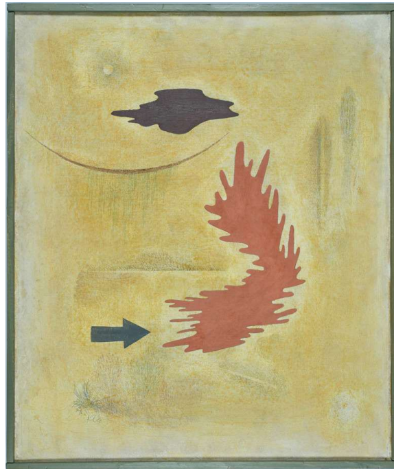
Paul Klee, Temps inestable , 1929

Roda de premsa: dijous 20 d'octubre de 2022, a les 12 h