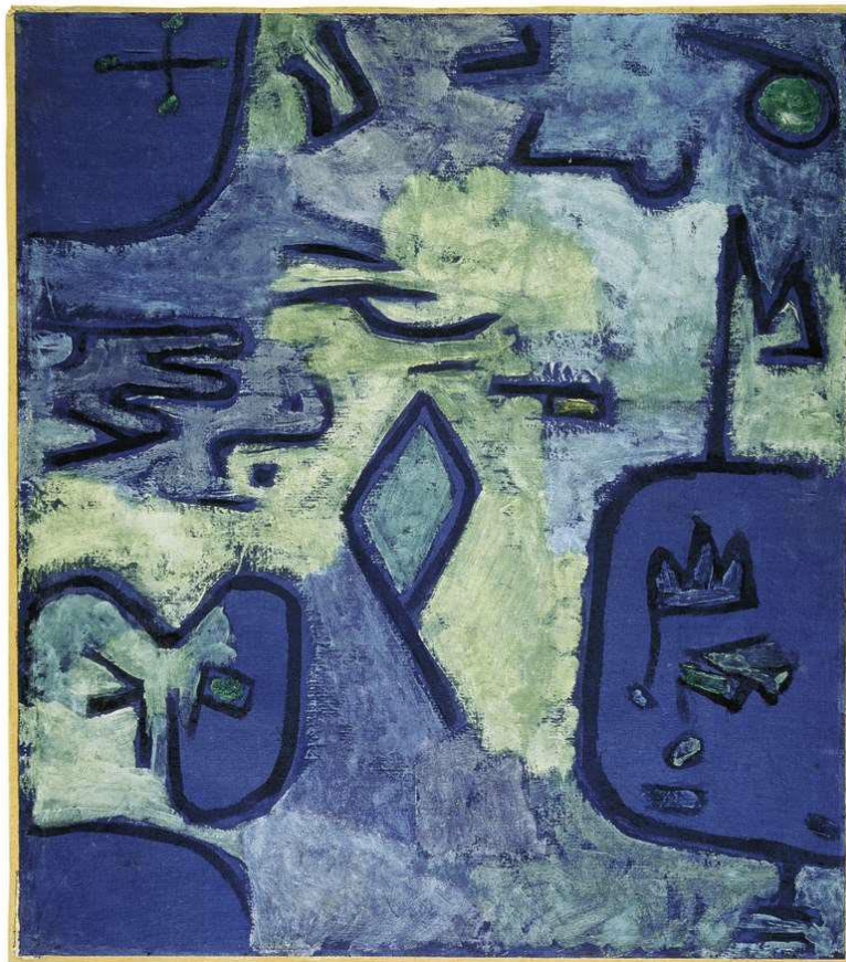
Paul Klee, l'alba , 1939