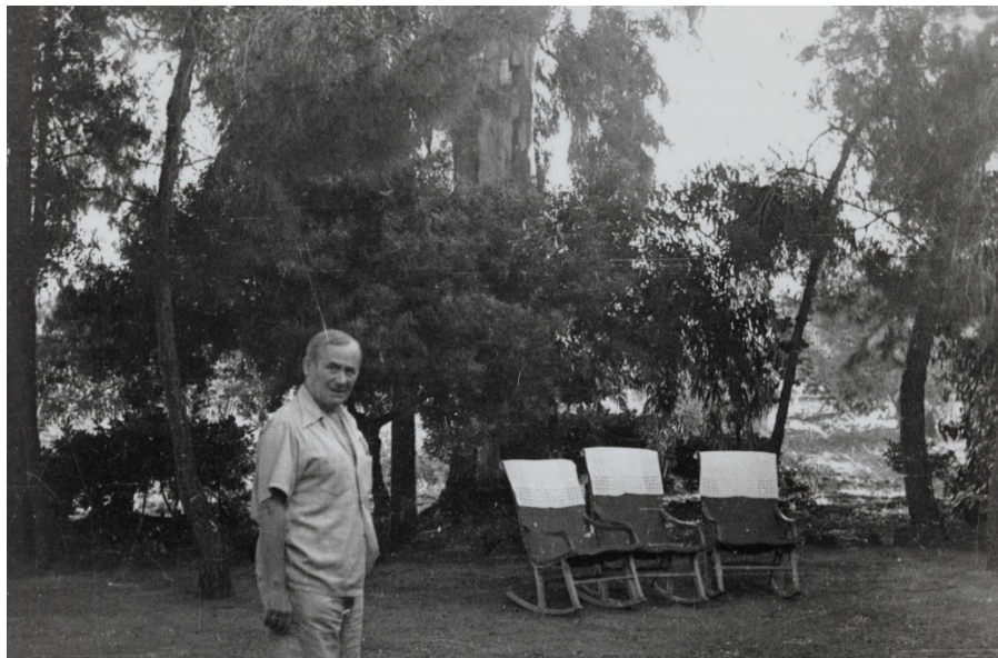
Enric Tormo, Joan Miró al jardí de casa seva a Mont-roig del Camp , Sense data

Imatges disponibles a: https://bit.ly/3GW2YP3