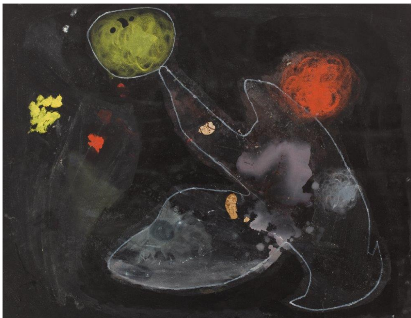
Joan Miró. Oiseau, 1938. Dibuix.

Imatges disponibles a: https://bit.ly/31Y1dIH