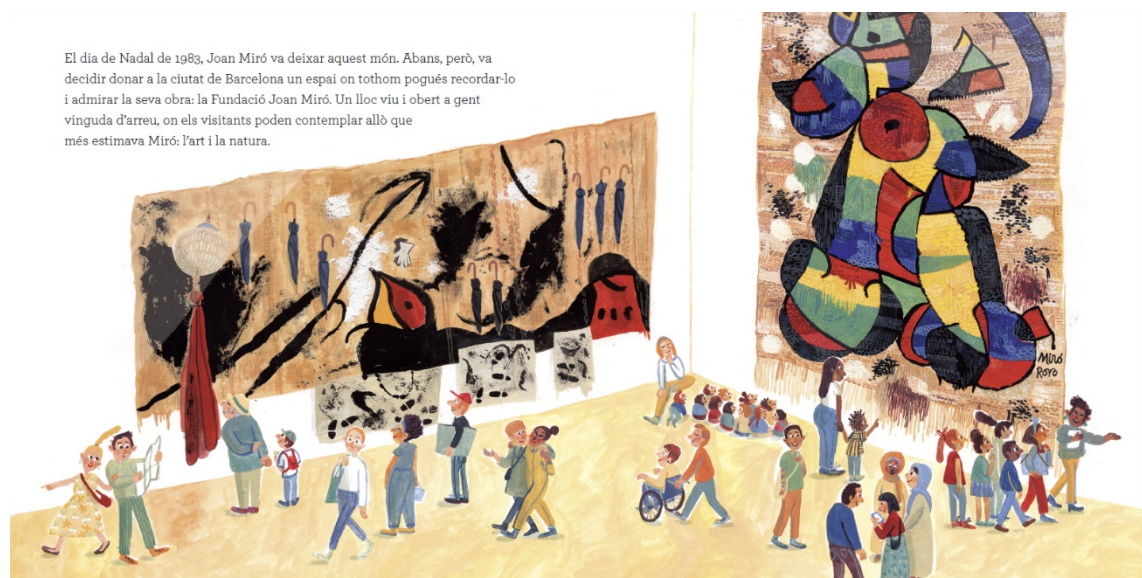
Mostra de pàgines interiors del llibre El llarg viatge de Joan Miró

L'any 2022, la Fundació continuarà amb la seva tasca de recerca i divulgació de l'obra mironiana amb un nou volum de la sèrie Miró Document , que aprofundirà en els orígens de la Col·lecció de la Fundació, constituïda a partir de la generositat de l'artista, de la seva família i dels seus amics. A banda d'aquesta publicació acadèmica, la publicació d'una biografia il·lustrada de Joan Miró, El llarg viatge de Joan Miró , oferirà l'oportunitat de descobrir en família la vida i l'obra d'aquest gran artista.